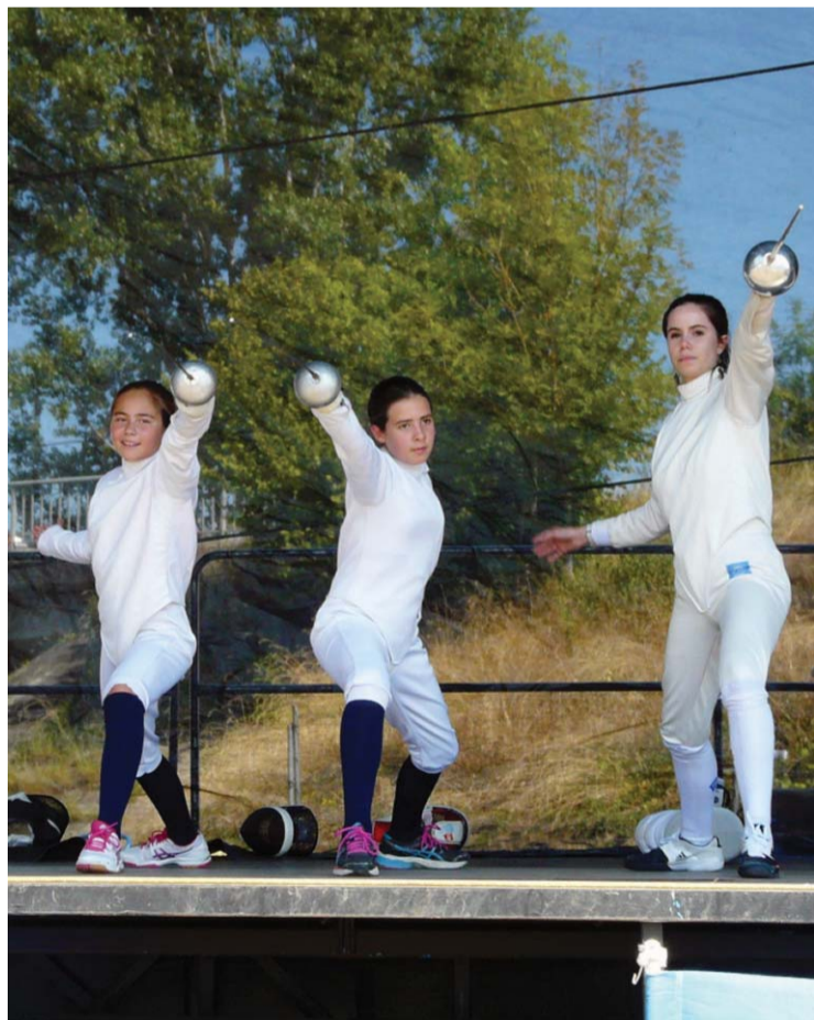
Le club de Boulazac-Isle-Manoire était en démonstration ce week-end.

(1) Soit, à Royan, 1,9 km de natation, 92 km à vélo et 21 km de course à pied.